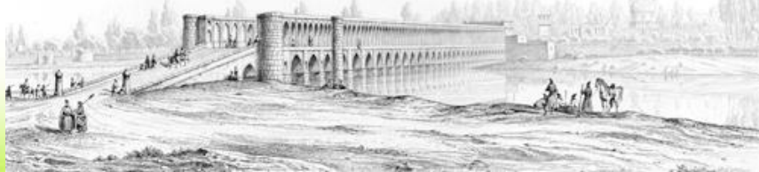
تصویر نقاشی شده از سی و سه پل توسط تاورنیه