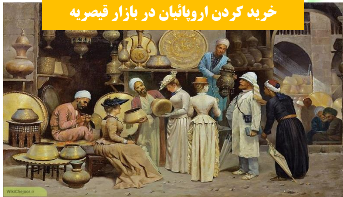
خرید کردن اروپائیان در بازار قیصریه

پادشاهان صفوی از هنرمندان و صنعتگران و دانشمندان حمایت و برای ساخت بناهای تاریخی نیز بسیار هزینه می‌کردند. البته مخارج و درآمد شاه و درباریان از راه مالیات‌هایی که از کشاورزان، بازرگانان، صنعتگران و سایر مردم می‌گرفتند، تأمین می‌شد.