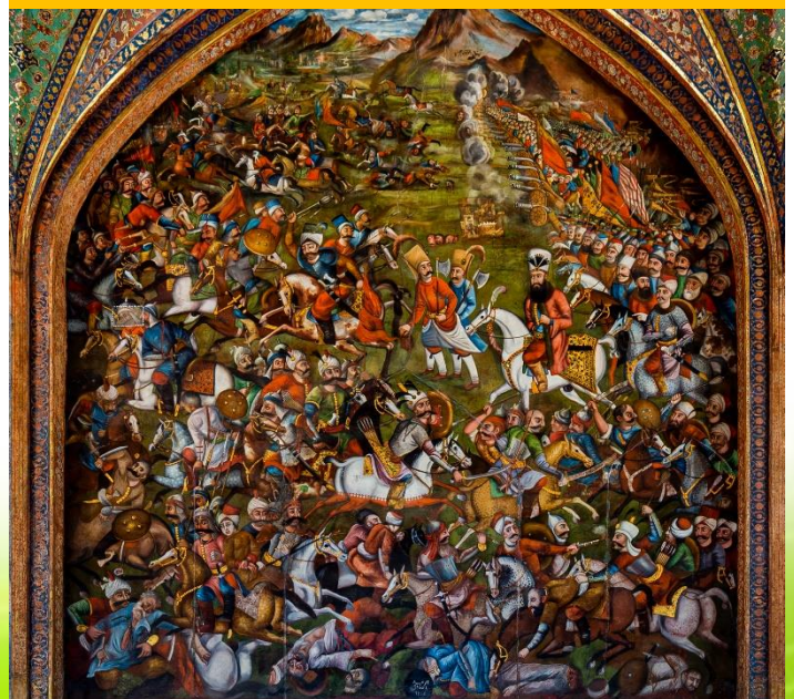
از یکی از جنگ‌های صفویان با دشمنان خارجی