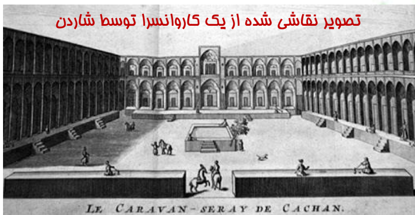
تصویر نقاشی شده از یک کاروانسرا توسط شاردن

✓ تاورنیه و شاردن: دو جهانگرد فرانسوی بودند که در دوره صفویه چندین بار به ایران سفر کردند و سفرنامه‌های آن‌ها در مورد وضعیت اجتماعی و سیاسی آن زمان بسیار معتبر هستند. هر دو جهانگرد پس از شاه عباس اول و در زمان جانشینان او، به ایران آمده‌اند. البته تاورنیه قبل از شاردن به ایران سفر کرده برای همین توصیفات او از اصفهان با شاردن متفاوت است. با مطالعه‌ی هر دو سفرنامه می‌توانیم به روند پیشرفت و شکوفایی شهر اصفهان در دوره صفویان پی ببریم.