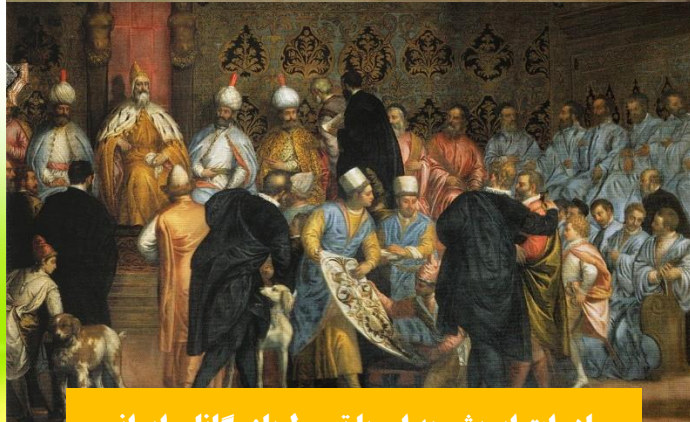
صادرات ابریشم به اروپا توسط بازرگانان ایرانی